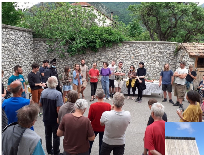
Pot d'accueil du chantier international du mois d'août au Saix