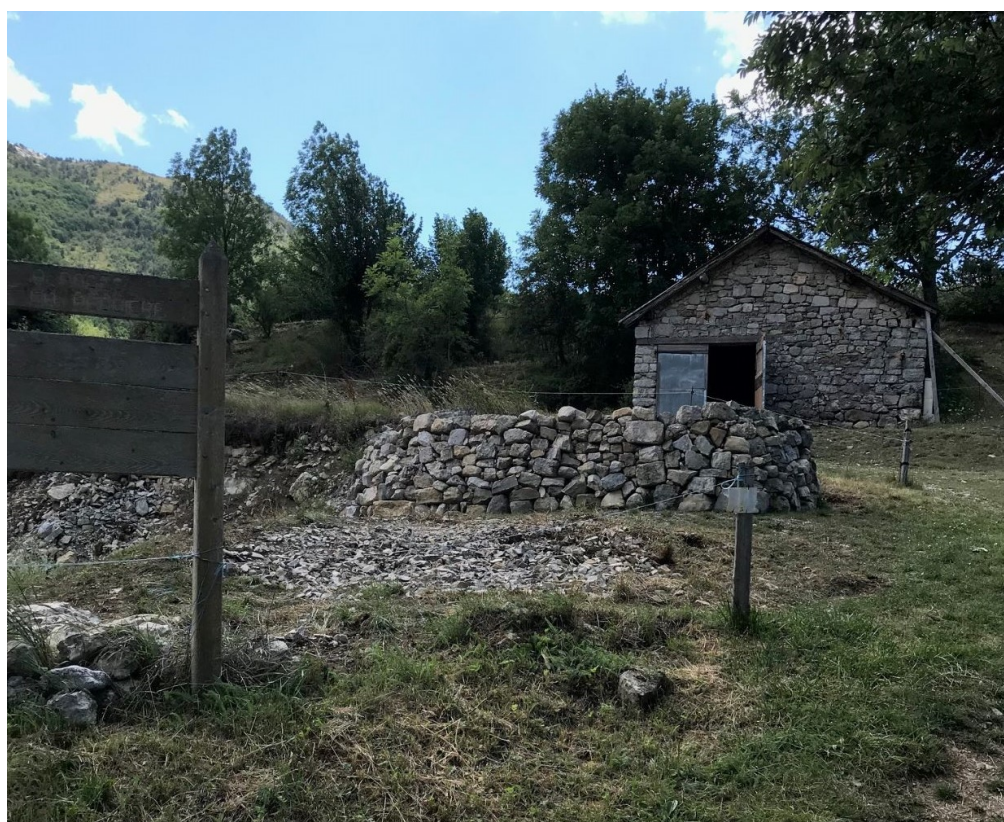
* La bergerie : : elle permet beaucoup de chantiers, donc de la dynamique, c'est une « respiration » sur les travaux sur le monument. Cette année, rangement des clapiers autour et dans la bergerie.