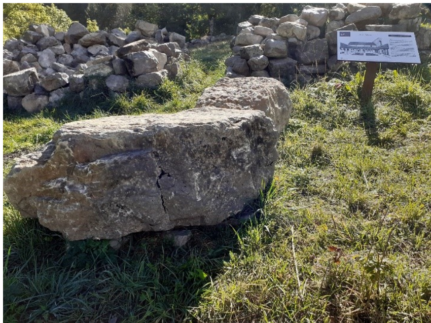
Blocs positionnés, en attente de leur panneau