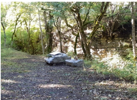
La carrière primitive