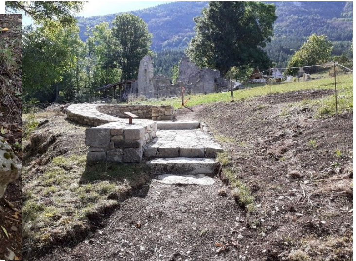
Assise du panneau transparent