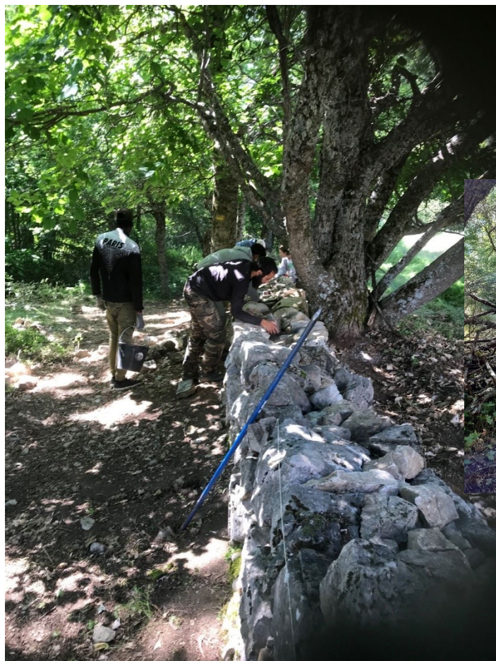
Sentier régénéré et lecture du panneau pédagogique dans cet ancien hameau du Saix.