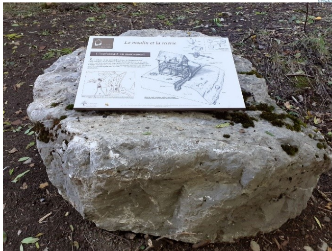
Rocher support du panneau du moulin ;