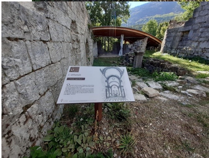
Dans la nef...